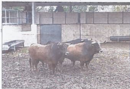
Toros de Garcigrande dans les corrales de Gimeaux.

INTERCOMMUNALITÉ | Le nouveau Schéma départemental de coopération intercommunale se dessine